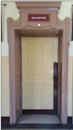
D1- ISTNIEJĄCE DRZWI WEWNĘTRZNE DO RENOWACJI.